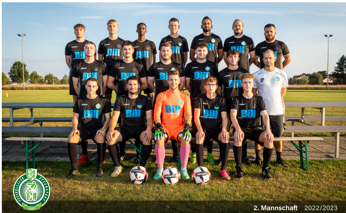
2. Mannschaft 2022/2023