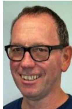
Infrastruktur Fred Biedermann