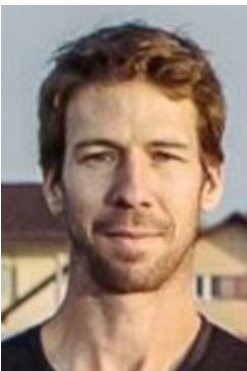
Infrastruktur Thomas Burkhart