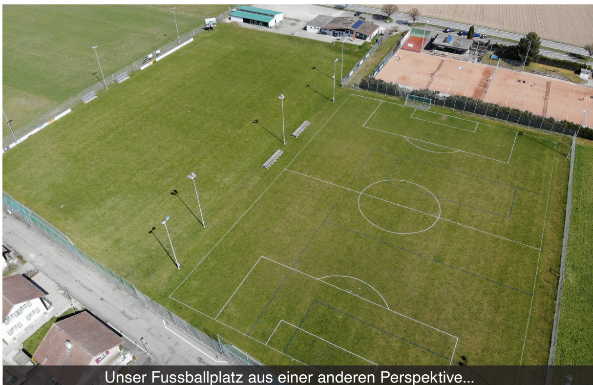
Unser Fussballplatz aus einer anderen Perspektive...