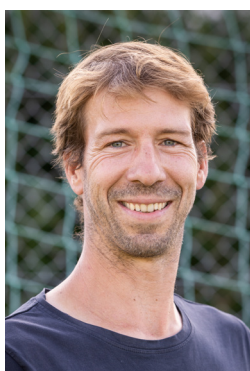
Infrastruktur Thomas Burkhart