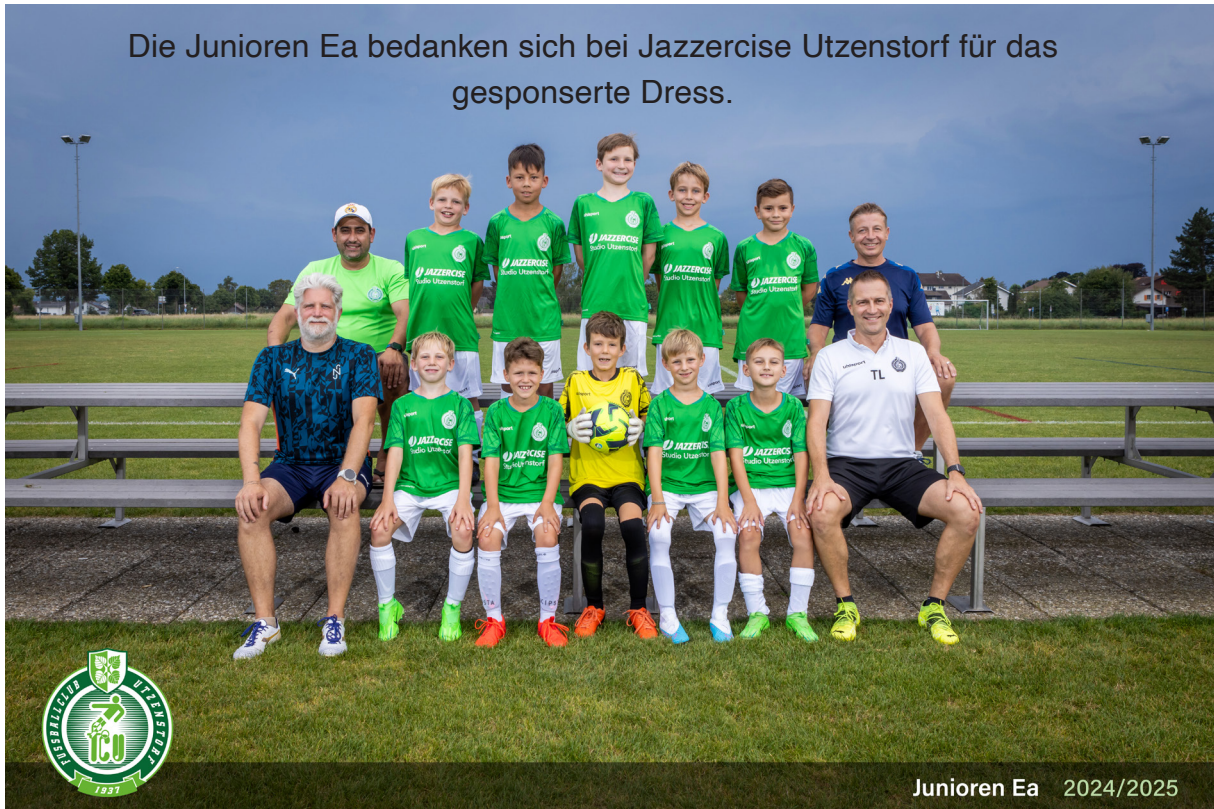
Junioren Ea 2024/2025

Die Junioren Ea bedanken sich bei Jazzercise Utzenstorf für das gesponserte Dress.