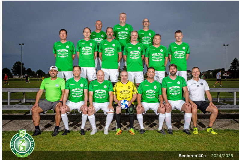
Senioren 40+ 2024/2025