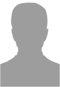
Leiter Senioren Vakant