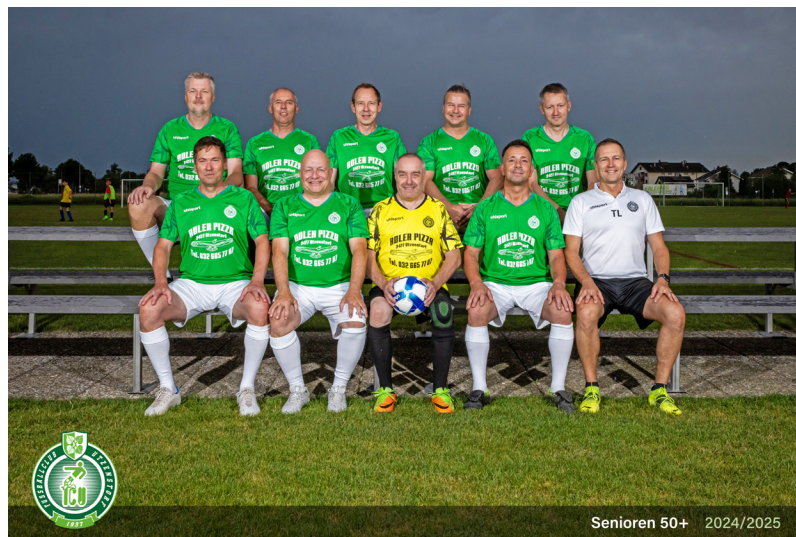
Senioren 50+ 2024/2025