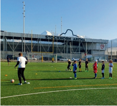
Training an einem schönen Wintertag