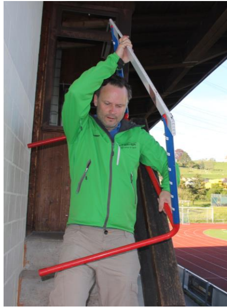
Die Sportgeräte des Turnvereins wären in der neuen Anlage ebenerdig gelagert.